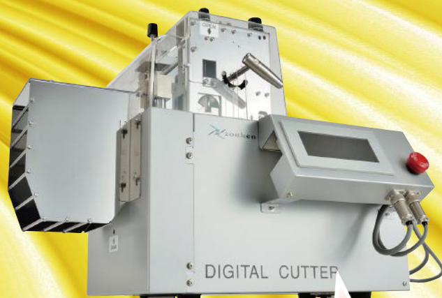
ZKC-325 スタンダードタイプ

走行面もワイドで、安定した切断が可能。 リニアガイド採用によりワークの平行度 確保